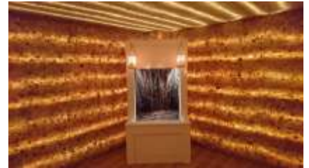
Tężnia Solankowa z Solą z Ciechocinka

Rozwój innych sposobów pozyskiwania soli oraz wzrost znaczenia balneologii w lecznictwie spowodował, że tężnie stały się miejscem służącym do zażywania inhalacji powstałego w ich otoczeniu specyficznego aerozolu. Mikroklimat powstały wokół tężni wykorzystywany jest w profilaktyce i leczeniu schorzeń górnych dróg oddechowych, zapalenia zatok, rozedmy płuc, nadciśnienia tętniczego, alergii, nerwicy wegetatywnej i w przypadku ogólnego wyczerpania.